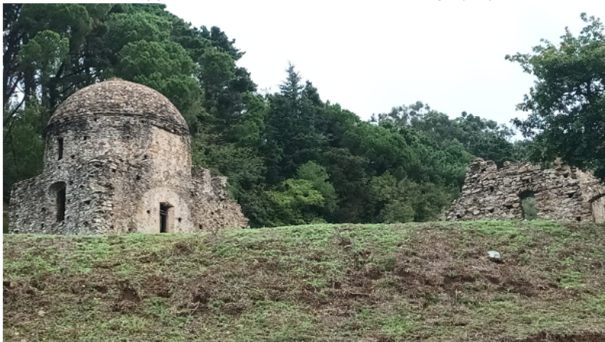
L'eremo di S. Elia – Curinga (Cz)

Villaggio Falkensteiner - Acconia di Curinga (CZ)